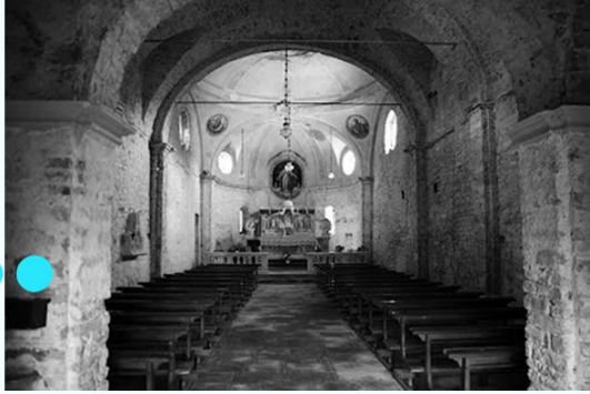
Nef interne ● ● ● ●