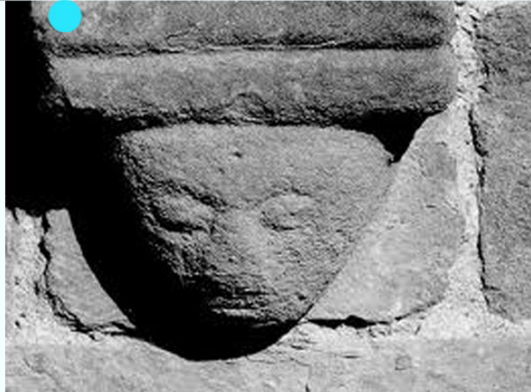
● ● ● ● Abside extérieur