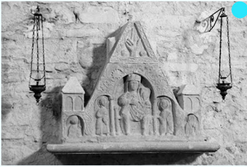
● ● ● Interne grès bas-relief représentant la Vierge et l'Enfant